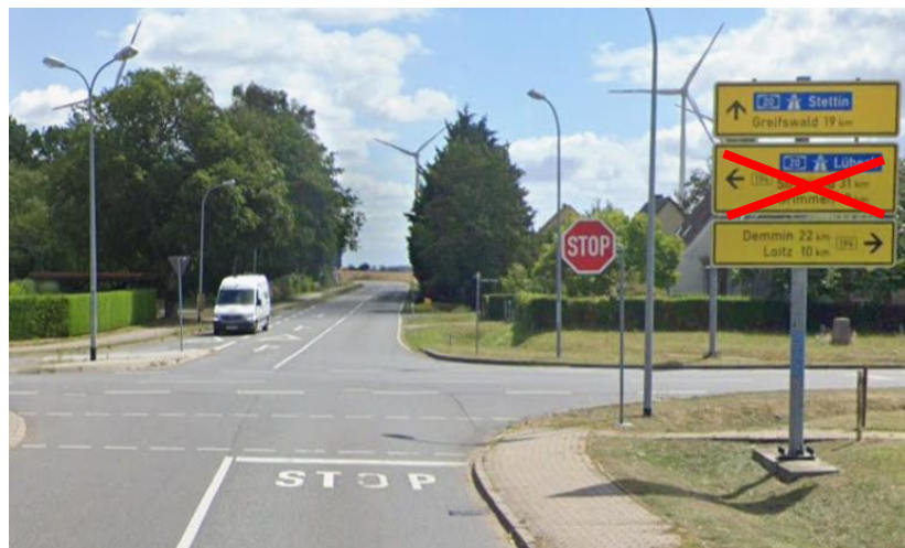
Anlage B 4