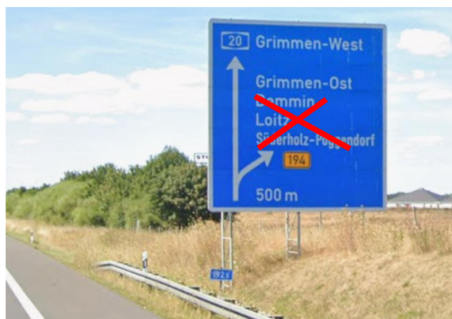
Anlage B 29