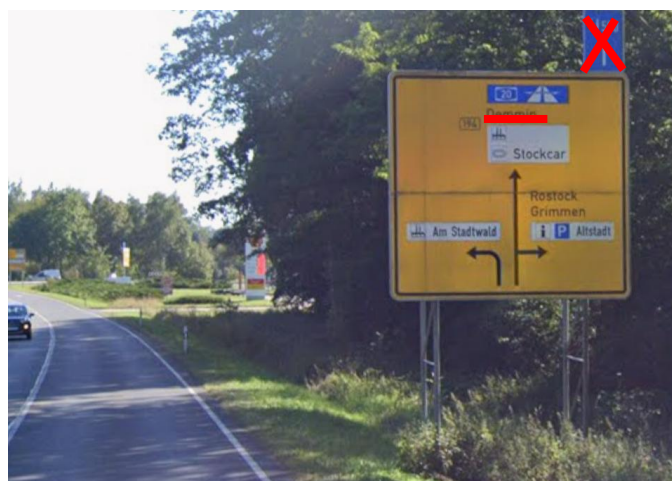
Anlage B 14