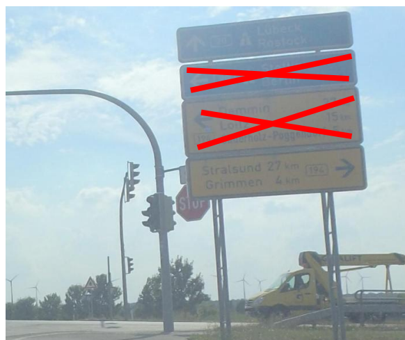
Anlage B 32