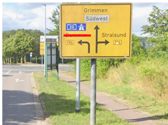
Anlage B 21