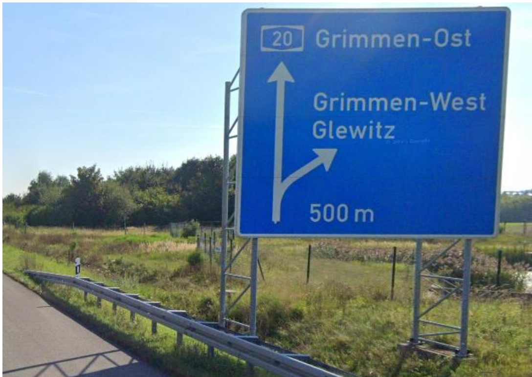
A20 vor AS Grimmen-West aus westlicher Richtung