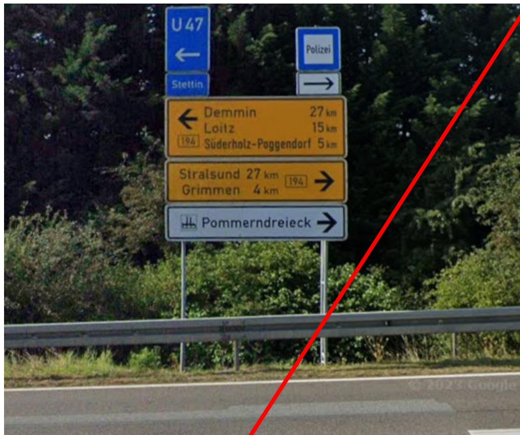
Einmündung Ausfahrt A 20 südöstlich der Autobahnbrücke zur B194