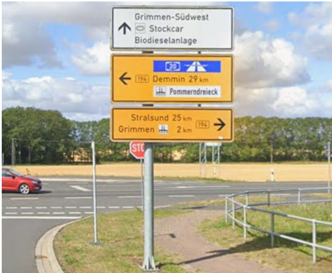
Kreuzung Zum Rauhen Berg / B 194 / Südliche Randstraße