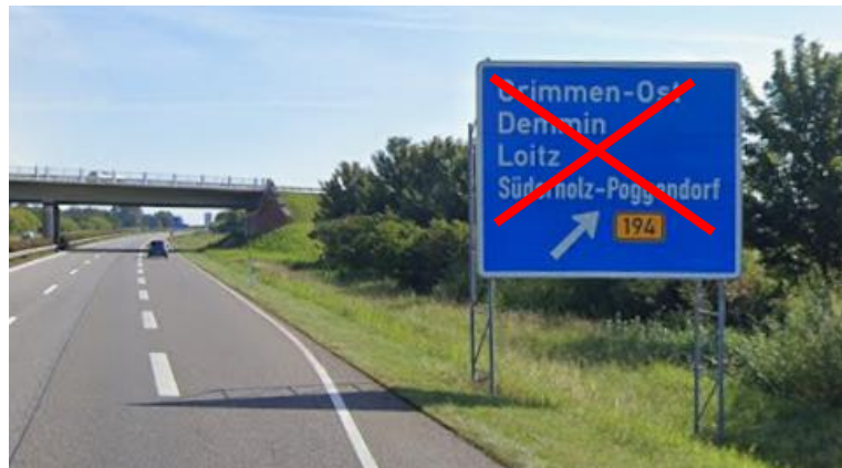
Anlage B 26