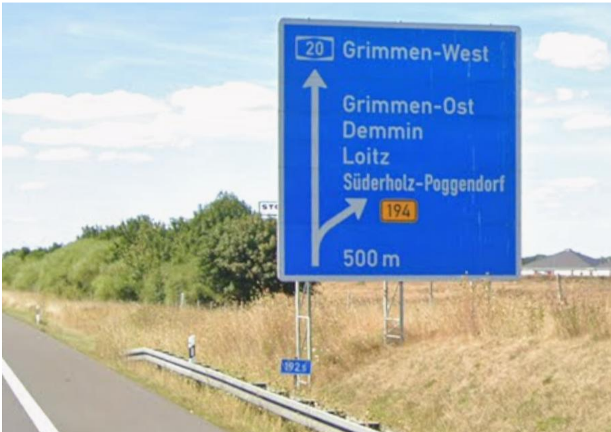
A20 Richtung AS Grimmen-Ost aus östlicher Richtung