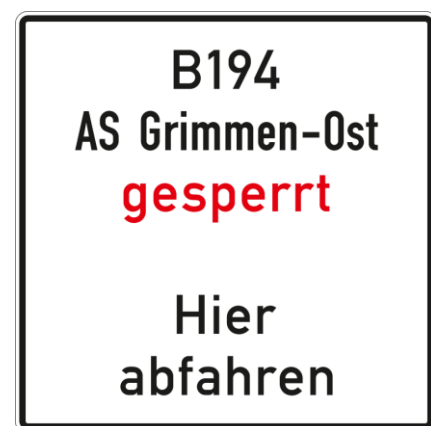
Anlage B 25